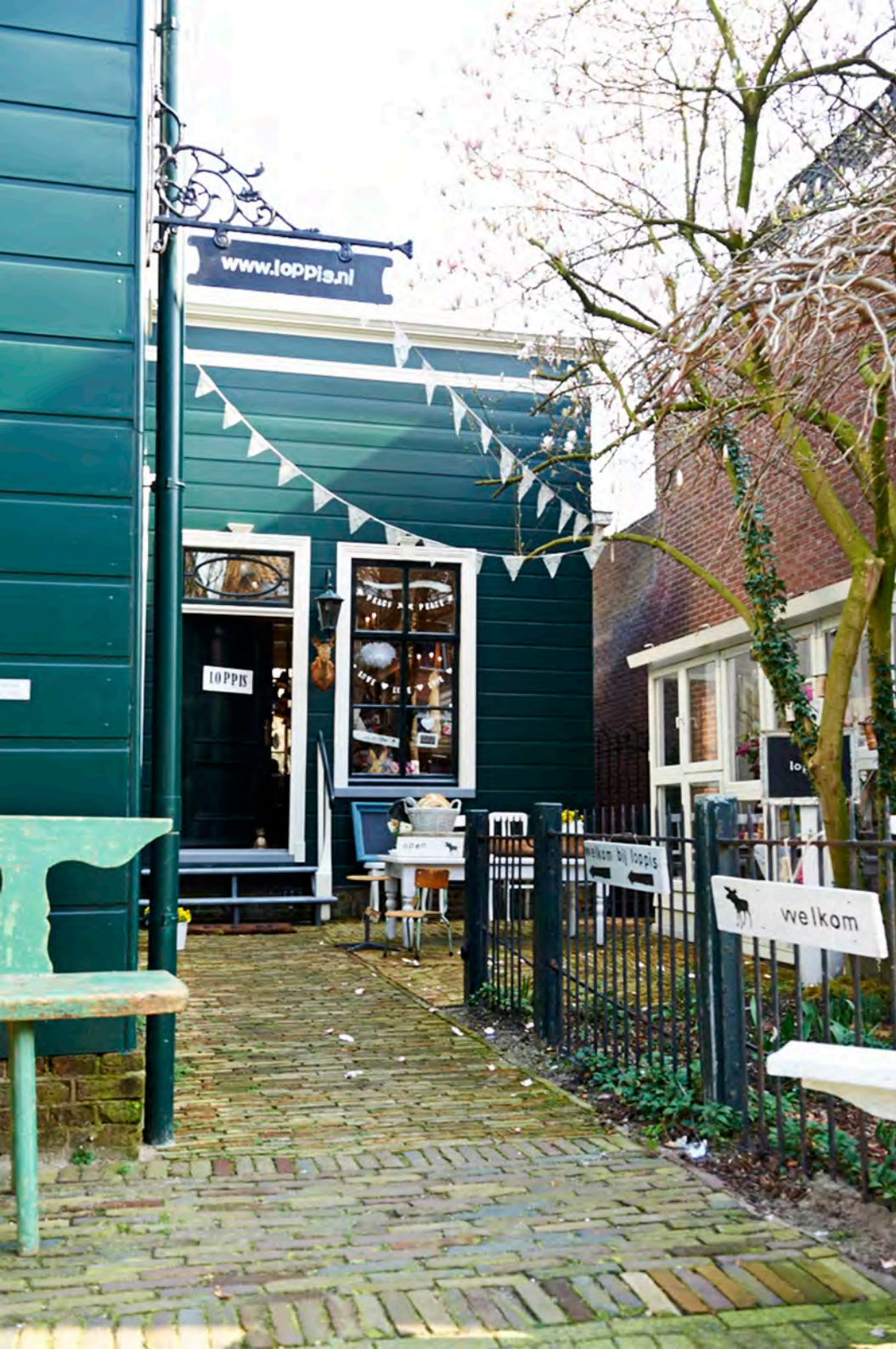
Styling Mieke Floore

Het winkeltje waar Josephien haar vondsten verkoopt zoals oude schoolstoeltjes en kaarten. De eland is overduidelijk het favoriete dier hoewel natuur en andere dieren ook goed vertegenwoordigd zijn in haar huis en winkel.